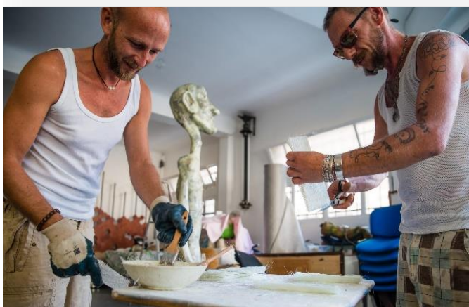
Le connectif KKF

Tél. 04 93 32 86 95 / www.saint-pauldevence.com